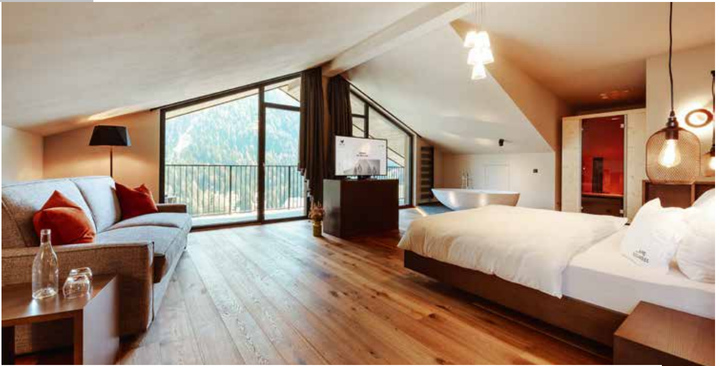
Mea Via – der Weg zum guten Leben, natürlichen Genuss, Wohlfühlen, tiefenentspannten Schlaf und Naturerlebnis.