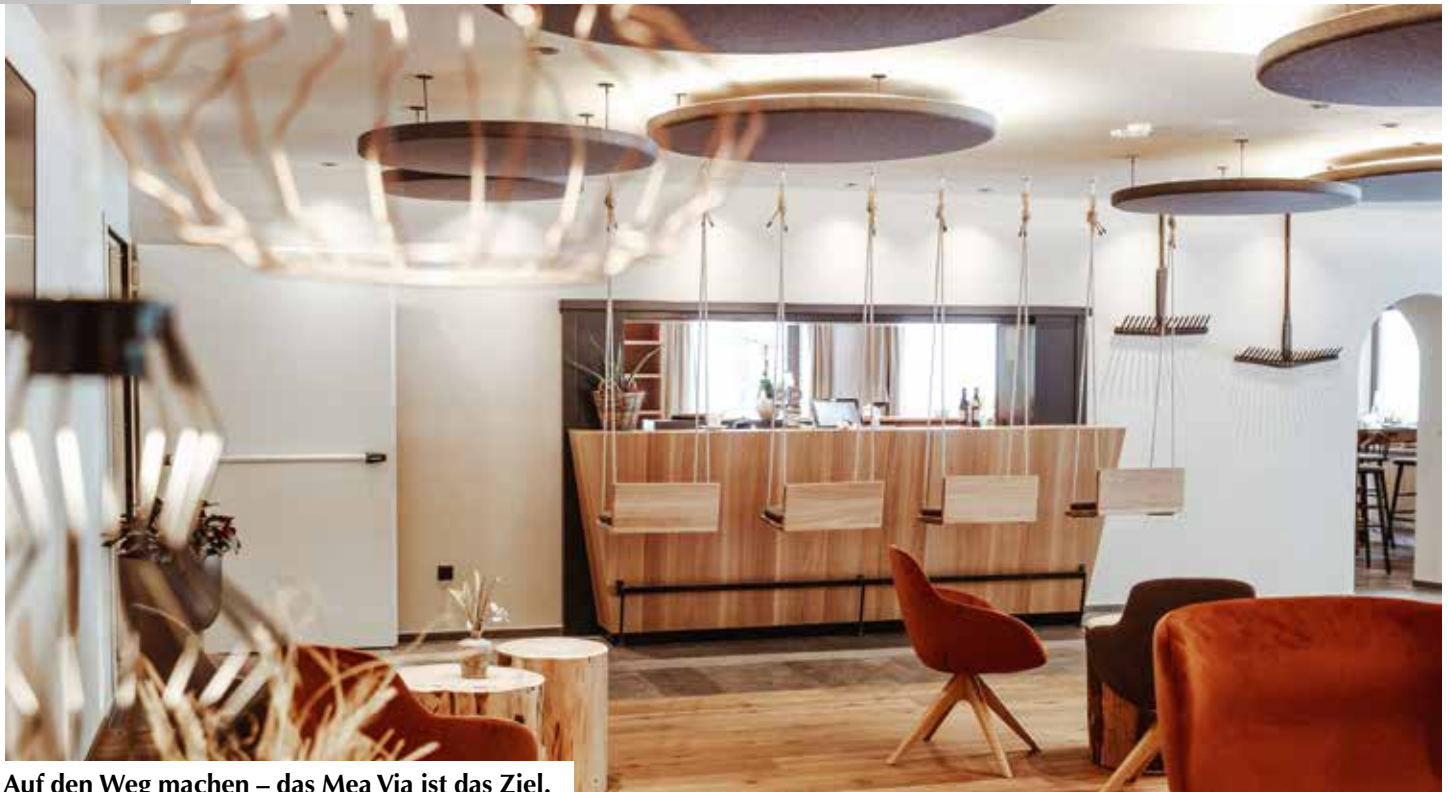
Auf den Weg machen – das Mea Via ist das Ziel.