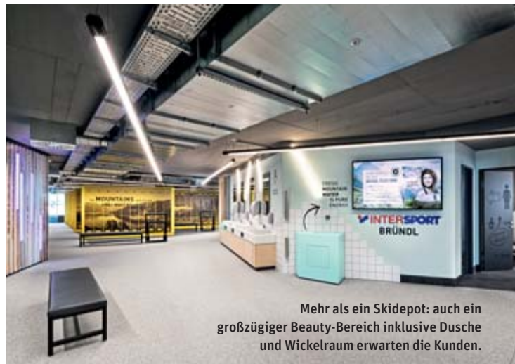
Mehr als ein Skidepot: auch ein großzügiger Beauty-Bereich inklusive Dusche und Wickelraum erwarten die Kunden.