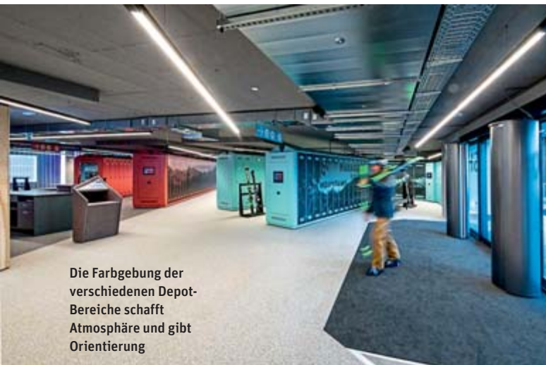
Die Farbgebung der verschiedenen Depot-Bereiche schafft Atmosphäre und gibt Orientierung