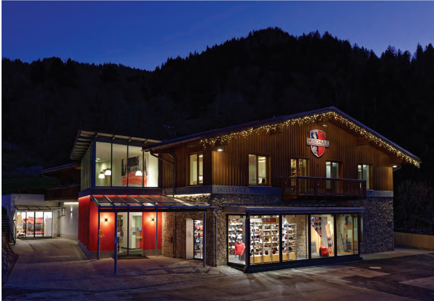
Bei jedem Schritt der Modernisierung standen die Bedürfnisse der Kunden und Mitarbeiter im Vordergrund.