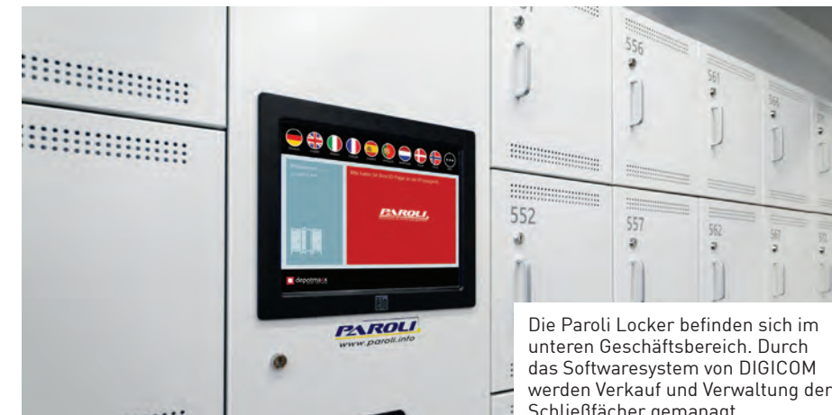
Die Paroli Locker befinden sich im unteren Geschäftsbereich. Durch das Softwaresystem von DIGICOM werden Verkauf und Verwaltung der Schließfächer gemanagt.

rung mit einer Kombination aus Umluft, Heizregister und Desinfektion. Diese Steuerung erleichtert die Reinigung der Depots und sorgt außerdem für einen schnelleren Wasserablauf direkt in den angeschlossenen Kanal. Damit bleibt der Schrankboden von lästigen Pfützenbildungen verschont. Für eine noch längere Haltbarkeit wurden alle kritischen Systemkomponenten aus Edelstahl gefertigt. Betriebsbildschirme wurden in der Nähe beider Eingänge installiert damit ist auch in den oberen Depoträumen die Führung des Besucherstroms optimiert. Das intelligente Steuerungssystem kann über eine Handy App bedient werden und erlaubt so jederzeit eine genaue Übersicht über den Status der Depots. Außerdem können verschiedene Bedienergruppen angelegt werden. So kann jeder Mitarbeiter nur auf den Bereich zugreifen, den er auch wirklich für seine Tätigkeit benötigt. tm